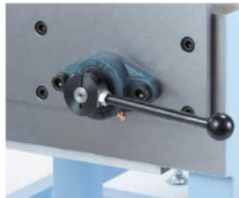
クランプハンドル