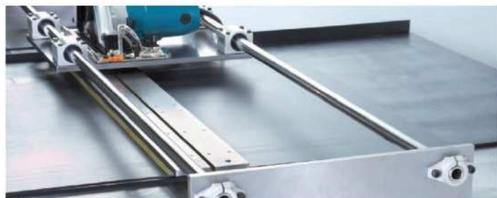
テーブル上面滑り止めゴム